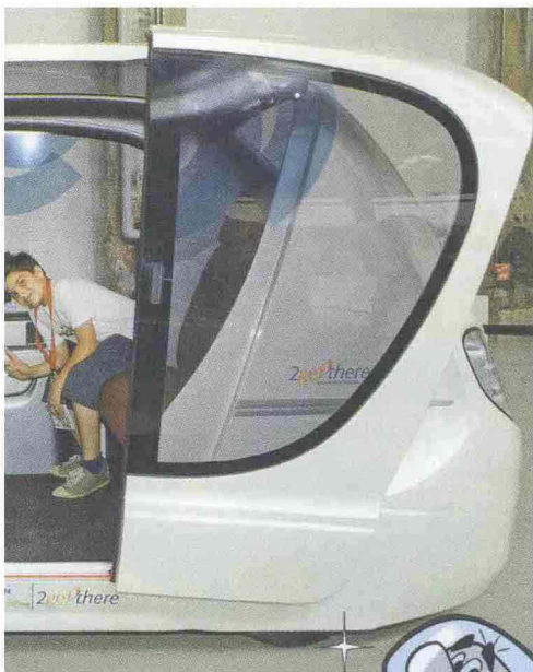
SOPRA: I NOSTRI TOPOREPORTER PROVANO LA MASDAR. SOTTO: PROVE D'EQUILIBRIO SUL SUOLO LUNARE!